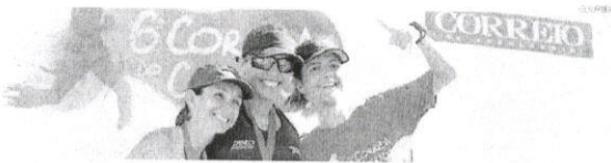
Vencedoras dos 5 km