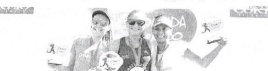
Vencedoras dos 10 km