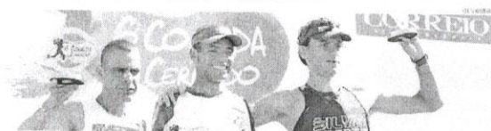
Vencedores dos 10 km